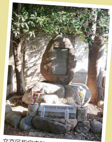
文京区指定史跡でもある。

コンドルのお墓は、墓地の奥まった場所にありました。敷地の四隅に木が植えられ、木漏れ日が優しく降り注ぎます。自然石を用いた墓石にはプレートが埋め込まれ、そこに刻まれているのが冒頭の言葉です。「日本の近代建築の父」、「日本文化の伝道師」と称されたコンドル。「LIFE'S WORK WELL DONE LOVING AND TRUE」は、愛に満ちあふれ、誠実に生き、生涯の仕事をやり遂げたその人生を讃える言葉でありながら、私たちに「人生をよりよく生きよう」と思わせてくれます。