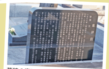
墓碑の裏面に経歴が刻まれている。