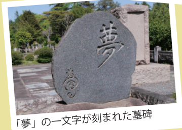
「夢」の一文字が刻まれた墓碑