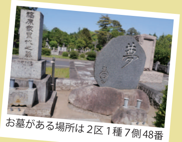
お墓がある場所は2区1種7側48番

墓碑の左下には、渦巻きのような文字（マーク？）が刻まれています。これも「夢」なのか、別のものを意味しているのか、分からないのですが、何か愛嬌が感じられ、夢声の人となり伝わってくるようでした。