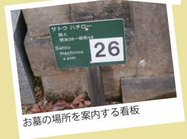
お墓の場所を案内する看板