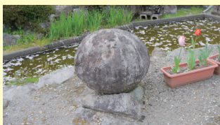
隣接する広場にも丸石が置かれています。