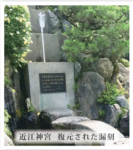
近江神宮 復元された漏刻