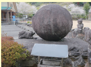
公共施設の敷地の入り口に鎮座する大きな丸石。

住民の方に聞くと、近くの河原では丸い石がよく採れ、この辺りでは玄関付近に飾っている家が多いそうです。その言葉どおり、何軒かのお宅で発見。丸い石は可愛らしくも神秘的な佇まい。伝説が日常に息づく玉取地区でした。